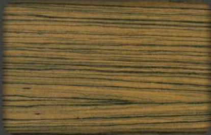
Light Wenge (*) EX.