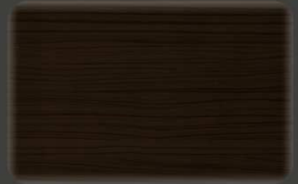
Wenge Royal (*)