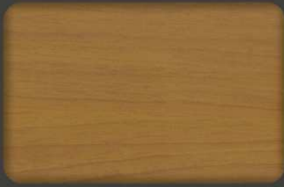
English Cherry (*) EX.