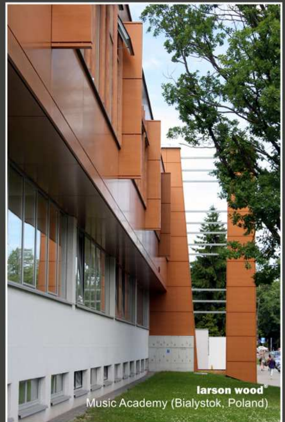
larson wood ® Music Academy (Bialystok, Poland)