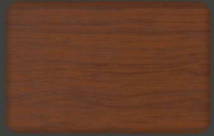
Colonial Red (*)