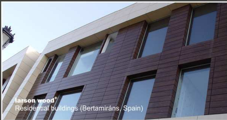
larson wood ® Residential buildings (Bertamirans, Spain)

(*) Stock 1500mm wide (other request availability)