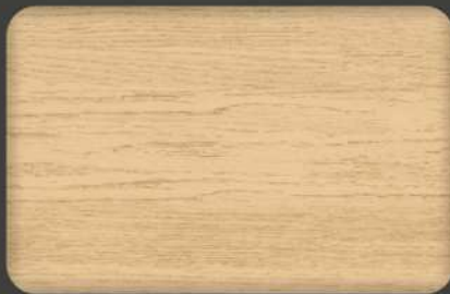
Elegant Oak (*) EX.