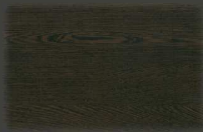
Dark Wenge (*) EX.

(*) Stock 1500mm wide (other request availability)